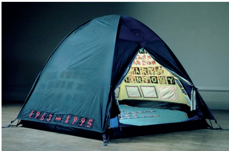
Tracey Emin. "Everyone I have ever slept with 1963-1995", 1995.

flexión de la emoción amorosa de los últimos años, la obra de la artista inglesa Tracey Emin.