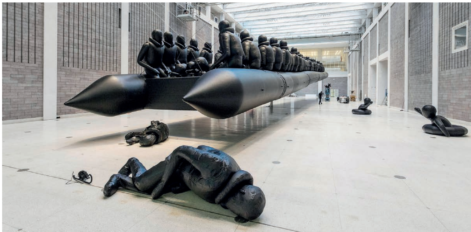
Ai Weiwei. "Law of the Journey", 2017.

toria personal. El objeto posee un leve movimiento similar al de un ser orgánico que estimula una sensación agradable y placentera, presentando un aspecto afectuoso de los aparatos tecnológicos.