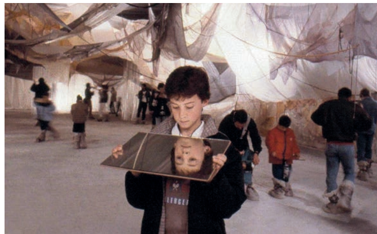
Mireya Baglietto. "La nube IV, tu espejo del universo", 1998.