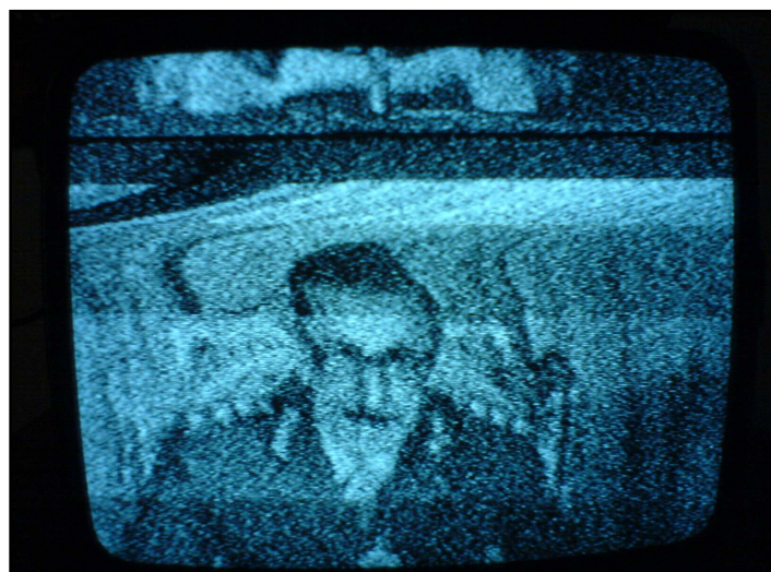
Alejandro Schianchi "Sin Título" Video Objeto (Detalle) 2006 (Reconstrucción 2011)

Muchas veces un fallo en el programa del aparato nos devuelve una imagen o un sonido imposible de concebir de otra manera. Los límites se desdibujan, y se nos presenta la 'verdad' desnuda, sin ropajes ni simulaciones. Datos, ondas, información expuesta según un mecanismo artificial que se define constantemente en sus errores. Es lo que lo hace único, revolucionario y bello. Allí reside su valor. Un corto-circuito en un artefacto construye un mundo nuevo, imprevisible, contenido en el campo artístico como un elemento estético más.